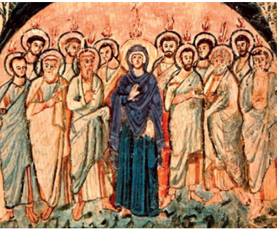
Ausgiessung des Heiligen Geistes zu Pfingsten (Rabbula-Evangeliar, 586)